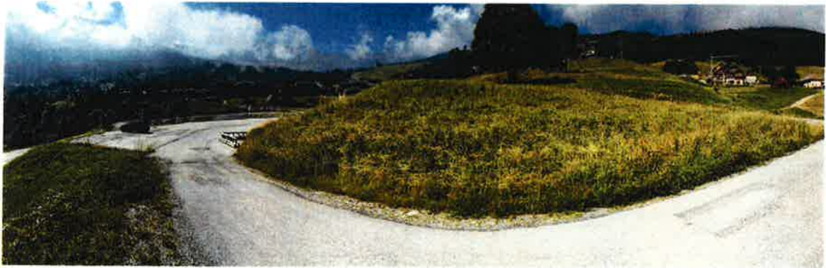
VUE PANORAMIQUE AMONT DE LA ROUTE D'ACCES A FONTAINE