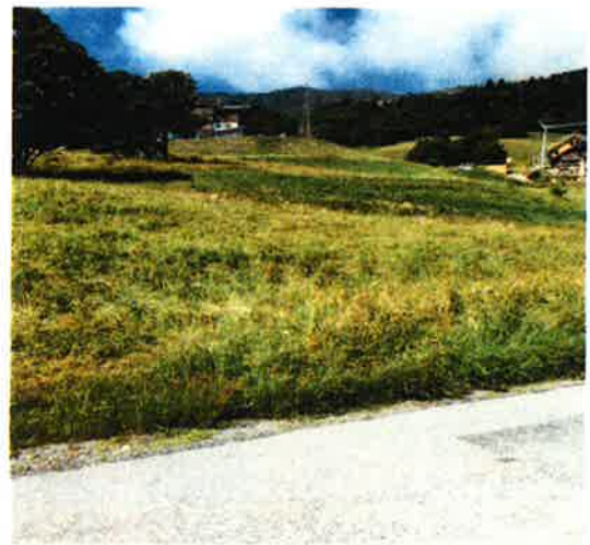
VUES PRISES DANS L'ALIGNEMENT AVEC LE TS DES LANCHETTES DE LA RD 95 ET DE LA ROUTE MENANT AU HAMEAU FONTAINE